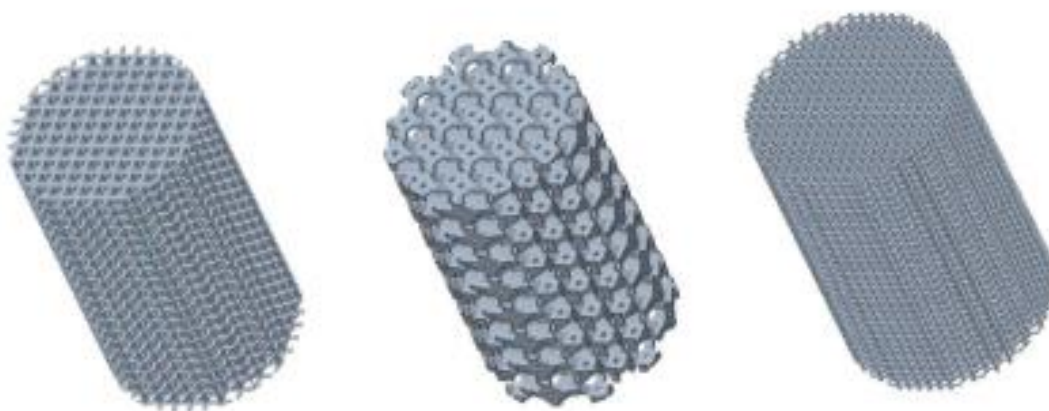
1. ábra: A, B, C próbatestek.

A tanulmányhoz szabványos próbatest modellek készültek (lásd: 1. ábra). A próbatestek egységcellákból, többféle kialakításban, az ISO 13314 szabvány (Net9) és az orvosi biológiai elvárások alapján lettek létrehozva nyomóvizsgálatok végzéséhez. Mindhárom próbatest 10 mm átmérőjű, és kb. 15 mm magasságú henger, ezek közül kettő eltérő kocka egységcellákból, egy pedig oktaéder egységcellákból lett felépítve (lásd: 2. táblázat).