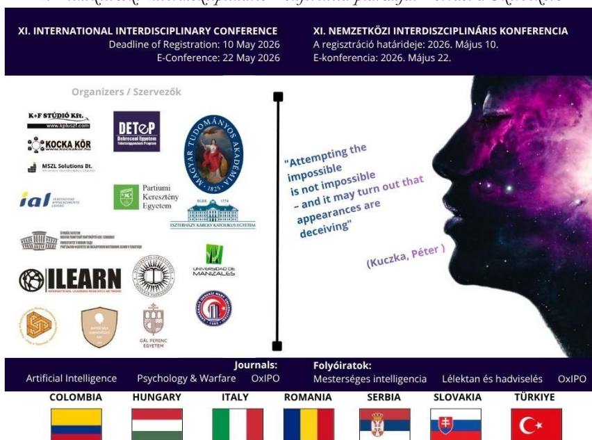
1. ábra. A XI. Nemzetközi Interdiszciplináris Konferencia plakátja.

tina, Románia, Szlovákia, Dél-afrikai Köztársaság, Srí Lanka, Szerbia, Thaiföld, Tunézia és Törökország) 217 résztvevője vett részt, és 151 előadása került közlésre (közük két nyilvános plenáris előadásra összesen 16 szekcióban (v.ö.: 2. ábra).