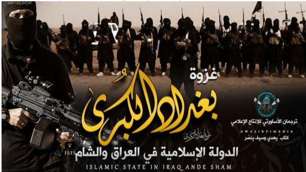
3. ábra: ISIS üzenet – How ISIS is spreading its message online.

terrorszervezetnek, mikor például – nem elhanyagolható tényezőként –, az anyagi erőforrások nyilván jóval korlátozottabbak voltak, mint például egy állami vagy kormányzati szereplő esetében? Az ISIS kifinomult propagandastratégiákat dolgozott ki, melynek végrehajtására elsődlegesen az olyan közösségi médiaplatformokat használta, mint a – fiatalok által közkedvelt – Twitter, Facebook és Youtube. Propagandastratégiájuk az erőszkos tartalmakon, a vallási narratívákon és az utópisztikus társadalom ígérten alapult. Képek, videók és az ezekkel célba juttatott üzenetek ezrei dicsőítették az ISIS „katonáinak” tetteit (lásd: 3. ábra), és a valóság eltorzított képével csalogattak fiatal férfiakat és nőket.