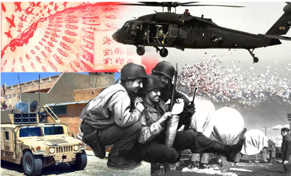
1. ábra: Lélektani műveletek illusztrációja egy képen.

A fogalom azonban önmagában csak a korábban említett alapot adja meg. A következő fejezetben megvizsgáljuk, hogyan is működik/működhet a lélektani hadviselés a gyakorlatban (1. ábra).