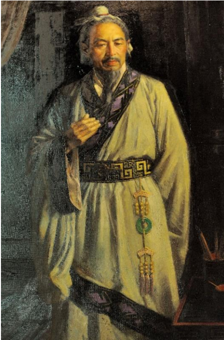
2. ábra: Szun-Ce.

érésére elsősorban az aszimmetrikus konfliktusok törekszik a gyengébb fél, akinek nincs olyan minőségű, mennyiségű fegyverarzenálja vagy humán erőforrása, hogy képes legyen felvenni a harcot e téren erősebb ellenfelével szemben. De ez így mégsem igaz. Ma már ugyanis azt is tudjuk, hogy az ellenség pszichéjére történő hatás gyakorlása – jó esetben – oly eredményes is lehet, hogy a látszólag erősebb fél sem mondhat le ezen eszközök alkalmazásáról, vagy az ellenük való védelemről anélkül, hogy ne kockáztatná a