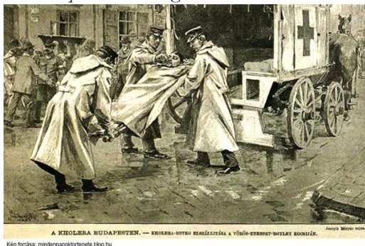
Kép forrása: mindennapoktortenete.blog.hu

1. kép: A kolera Budapesten, Forrás: mindennapoktortenete.blog.hu , 2014