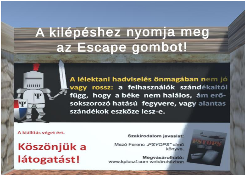
6. ábra: a PSYWAR kiállítás záróablója.