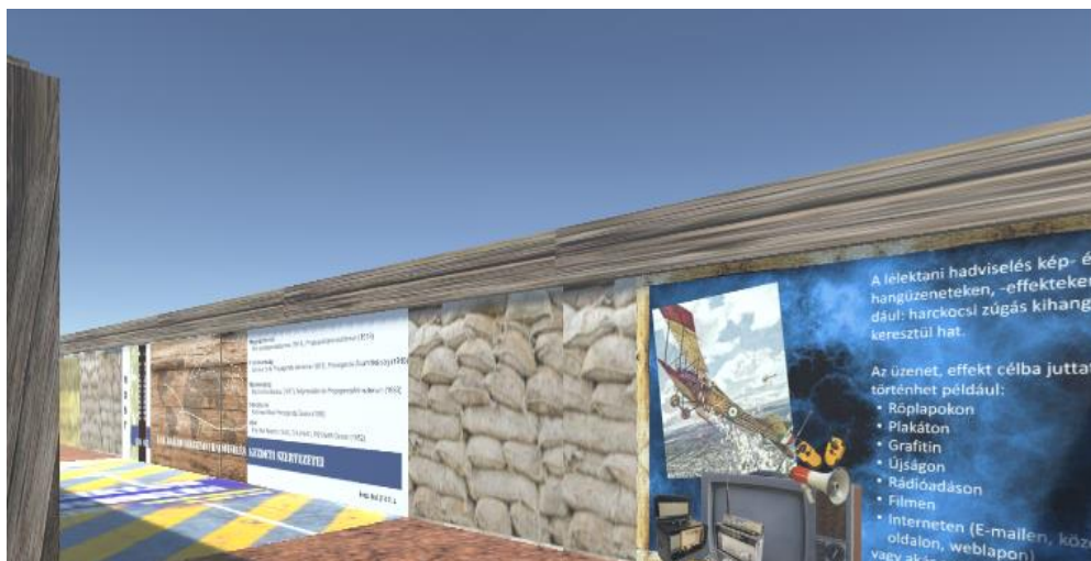
4. ábra: részlet a PSYWAR kiállítás humán szükségletekkel kapcsolatos (had)történelmi példákat bemutató tablóból.